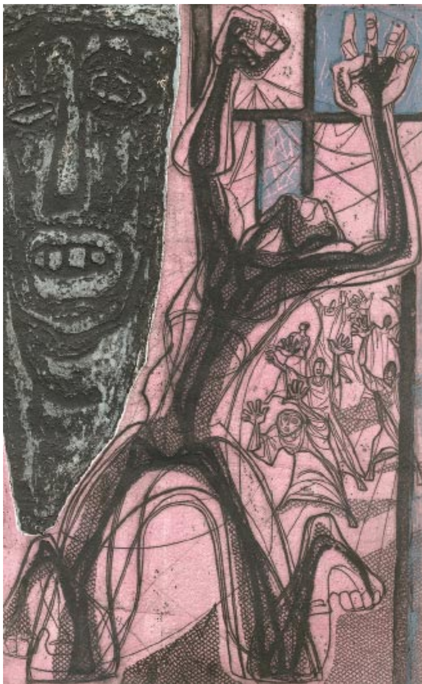
Barabbas, hij werd vrij gelaten, de Zoon van de Vader uitgeleverd.