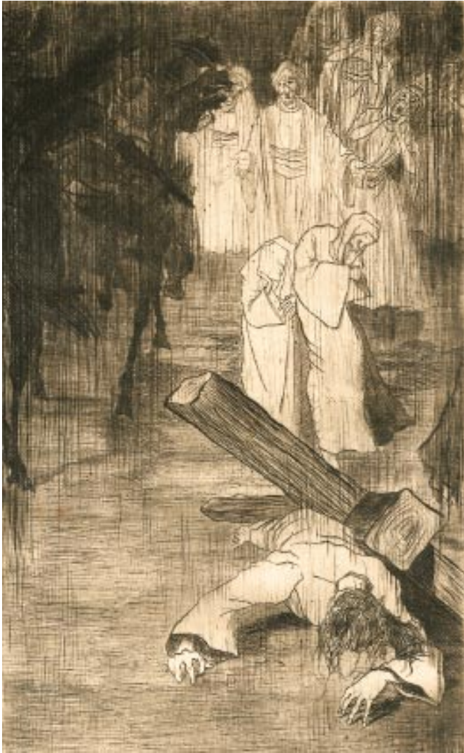
O, hoofd bedekt met wonden